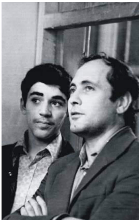
Г. Каспаров и Л. Листенгартен наблюдают за партиями бакинского международного турнира