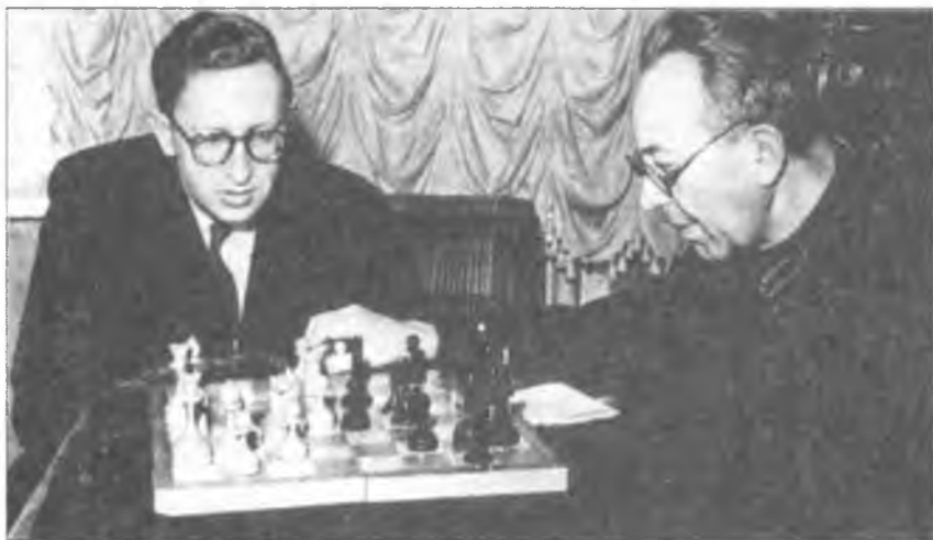
В. Смыслов и Г. Левенфиш

винника, поделившего 1-2-е места с Капабланкой, красуются семь ничьих против «головы» турнира и шесть единиц против «хвоста». Лектор заострил на этом внимание и объяснил успех Ботвинника методом подготовки к турнирам. Дескать, заранее усиленно готовит дебютные схемы против тех, кто послабее, стрижет их наголо, а с сильными делает ничьи. Конечно, это было несправедливо по отношению к игре Ботвинника. То что он уделил особое внимание аналитической подготовке к соревнованиям в домашней обстановке, стало позднее азбучной истиной, однако Ботвинник не уклонялся от бескомпромиссных схваток с любимыми соперниками. Был бойцом. Факт.