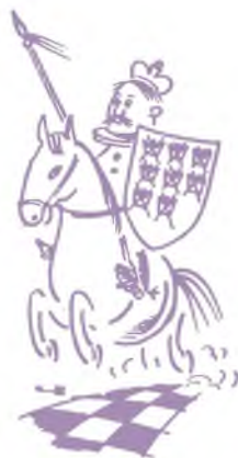
Рис. В. Чекарькова.