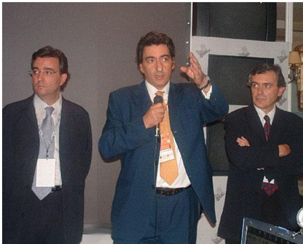
Обличительное слово Георгиоса Макропулоса