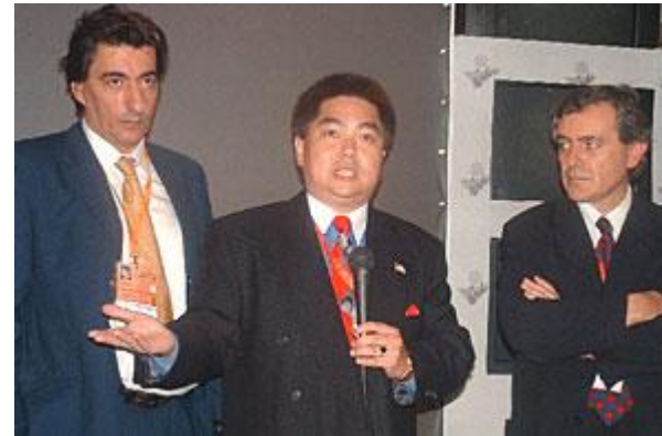
Выступает очевидец – капитан сборной США