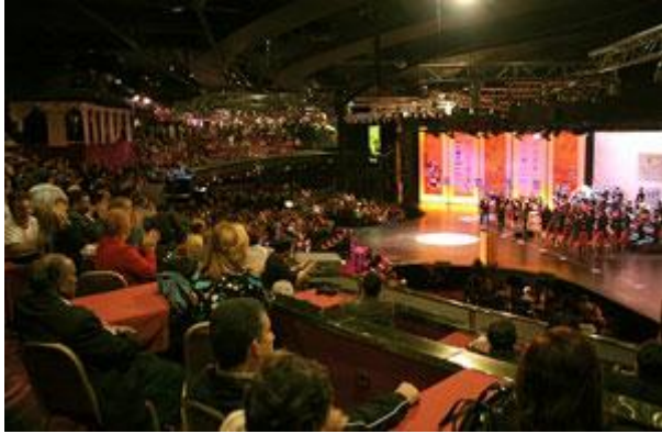
Идет закрытие XXXVI олимпиады...