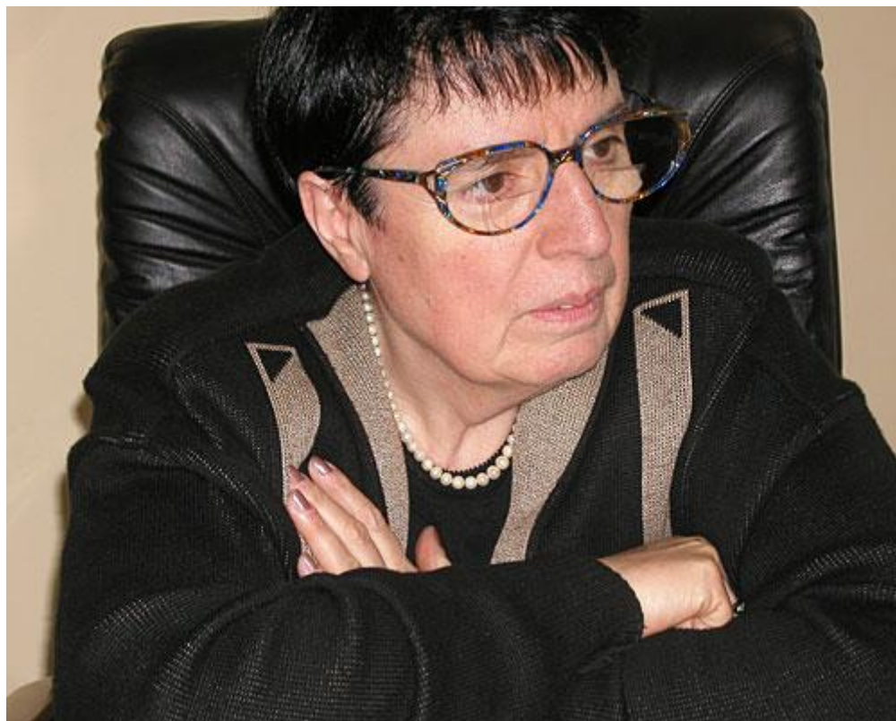
Великая чемпионка Нона Гаприндашвили