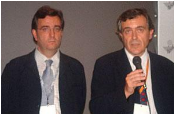
Организаторы делают свое заявление