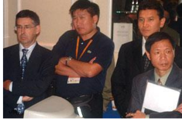
В зале среди зрителей – президент ФИДЕ Кирсан Илюмжинов